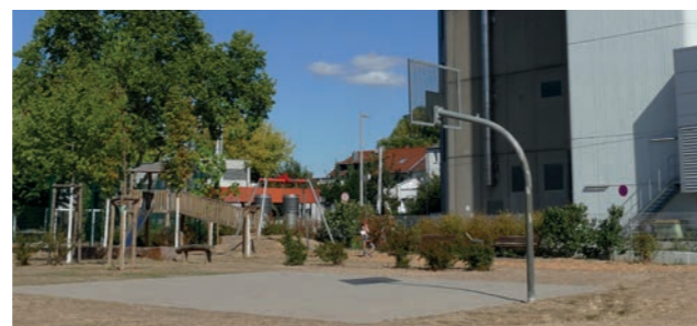
Abbildung 32: Derzeit nicht anfahrbarer Spielplatz in der nördlichen Platensiedlung

Der Spielplatz neben der Kita gehört der Stadt Frankfurt. Der Spielplatz an der Sudermannstraße gehört der ABG FRANKFURT HOLDING. Ziel ist es, diese Spielflächen neu zu ordnen und zu entwickeln. Insbesondere der Spielplatz an der Sudermannstraße bedarf einer Aufwertung.