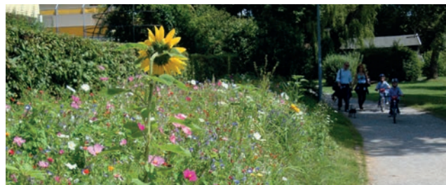
Abbildung 36: Beispiel für einen Blühstreifen

Die Grünflächen im Fördergebiet sind durch artenarme und monotone Bepflanzung geprägt, das soll sich ändern. Ziel ist es die kleinräumige Biodiversität zu erhöhen und die Möglichkeit zur Naturerfahrung in den bestehenden Grünanlagen zu stärken. Dieses Projekt kann an vielen verschiedenen Orten und gemeinsam mit lokalen Akteuren umgesetzt werden.