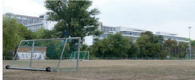
Abbildung 35: Sportplatzband

Die Sportplätze nördlich der Wilhelm-Epstein-Straße sind aktuell allein der Vereinsnutzung vorbehalten. Auf den beiden westlichen Sportplätzen wird vom Frankfurter Verein TuS Makkabi ein neues Sportzentrum entwickelt. Die drei östlichen Sportplätze werden von der Stadt Frankfurt erneuert. Hier wird eine öffentliche Nutzung der Felder außerhalb des Vereinsbetriebs angestrebt und geprüft