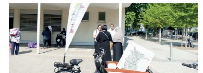
Abbildung 15: Aufsuchende Beteiligung

Um die Gruppe der erreichten Personen zu erweitern, wurden im „Grünen Ypsilon“ die Beteiligungsangebote um eine aufsuchende Bürgerbeteiligung ergänzt: Mit einem speziell gestalteten Lastenfahrrad waren die Planer/innen an drei Tagen im Fördergebiet unterwegs. Sie sprachen die Menschen vor Ort an und baten um ihre Hinweise.