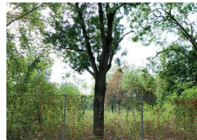
Abbildung 8: Brachfläche am iranischen Konsulat

Nördlich des Sportplatzbandes ist ein breiter Freiraumkorridor vorhanden, der sich bis an die Platenstraße erstreckt. Ein öffentlicher Weg durchzieht den Bereich, der