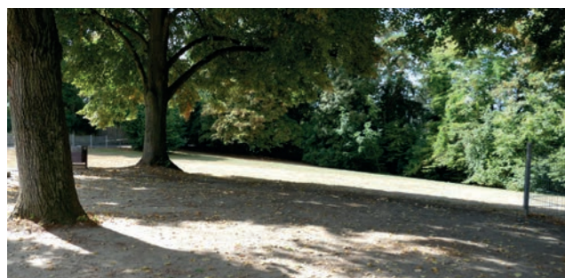
Abbildungen 31: Niddahang ohne Ausblick

Eingang in das Gebiet gestalterisch neu zu inszenieren