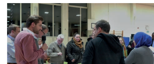
Abbildung 14: Infoveranstaltung

Bei der öffentlichen Informationsveranstaltung präsentierte das Planungsteam am 22. November 2018 die Ergebnisse der freiraumplanerischen und sozialplanerischen Untersuchungen sowie die Eckpunkte des ISEK.