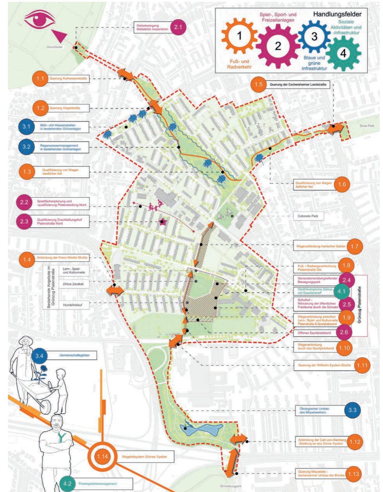
Abbildung 16: Rahmenplan mit allen Maßnahmen