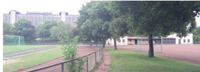
Abbildung 23: Lage der angestrebten Wegeverbindung im Sportplatzband

in Nord-Süd-Richtung trägt als Wegeachse im gesamtstädtischen Kontext zur Verbesserung der Wegebeziehungen für den Fuß- und Radverkehr bei. Das Projekt ist jedoch von den Planungen zum Umbau der Sportplätze und dem Trassenverlauf der U 4 abhängig.