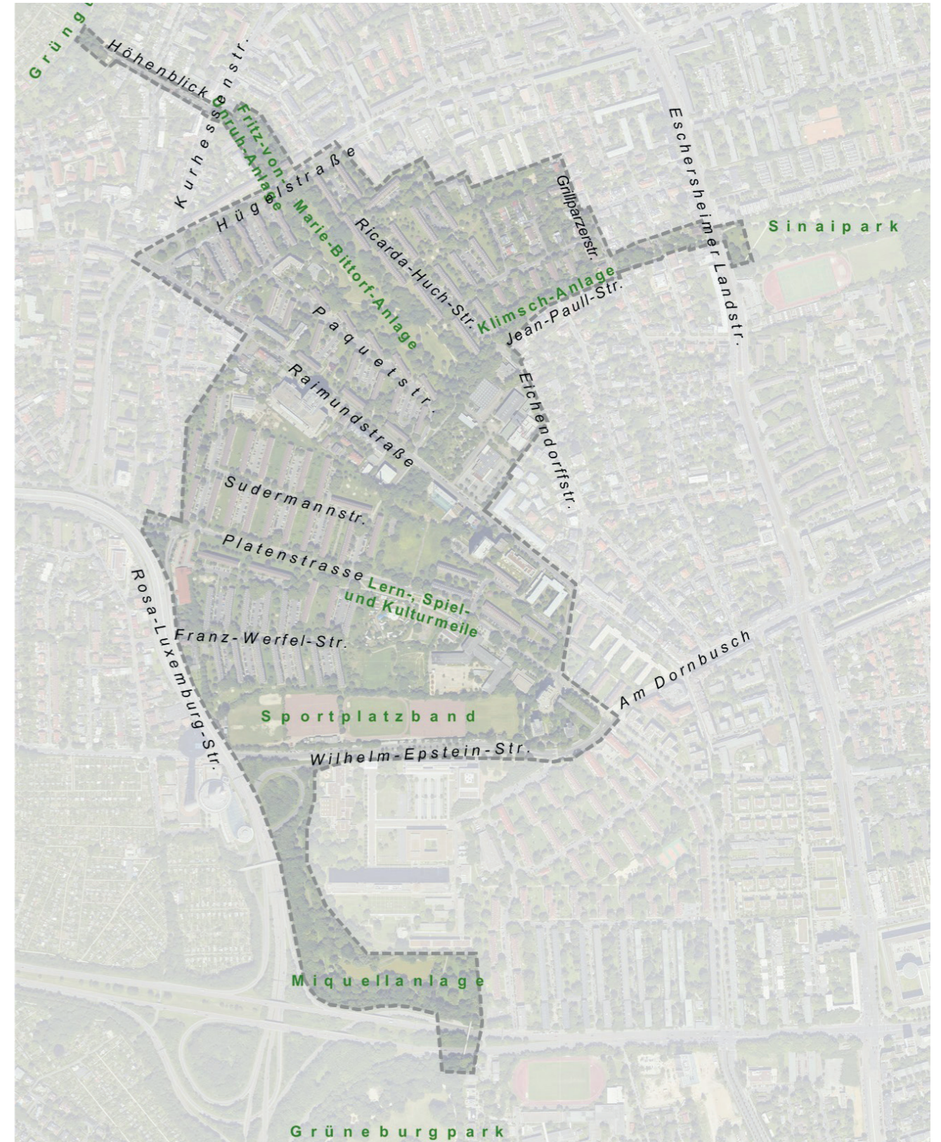
Abbildung 2: Fördergebiet im Detail