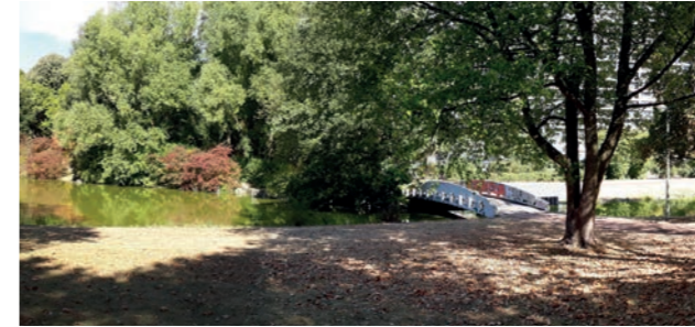
Abbildung 38: Miquelweiher

Wasserflächen spielen neben ihrem Erholungswert eine wichtige Rolle für Biodiversität und Stadtklima. Die Wasserqualität des Weihers ist regelmäßig besonders in den Sommermonaten stark gefährdet. Ziel ist es die Wasserqualität durch einen ökologischen Umbau zu stabilisieren und eine lokale Verbesserung der Artenvielfalt zu erreichen. Der Miquelweiher soll so in seiner Funktion als Trittsteinbiotop gestärkt werden, aber auch weiter als Anziehungspunkt für Erholungssuchende dienen.