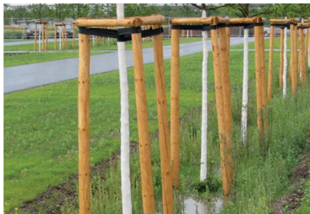
Abbildung 37: Beispiel für Regenwasserversickerung

Regenwassermanagement und Vorsorge zum Überflutungsschutz haben in den vergangenen Jahren weiter an Bedeutung gewonnen. Ziel ist es, eine modellhafte Qualifizierung der Grünanlage zu erreichen, in der zusätzlich zu der vorhandenen Nutzung für Freizeit und Erholung auch eine verträgliche Nutzung für das Regenwassermanagement benachbarter Siedlungen abgebildet werden kann.