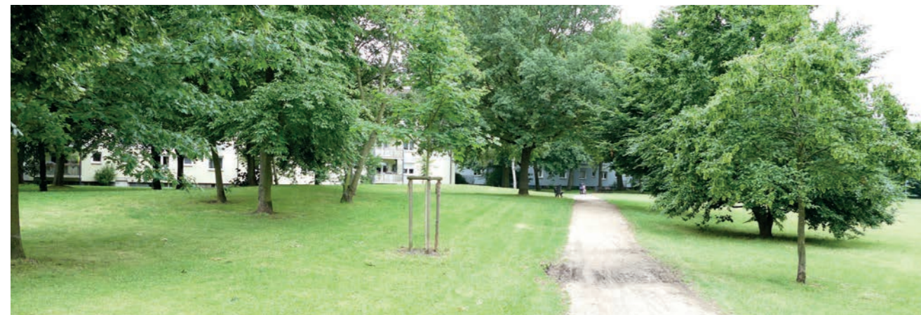
Abbildung 4: Beteiligung zum Projekt Grünzug Platenstraße