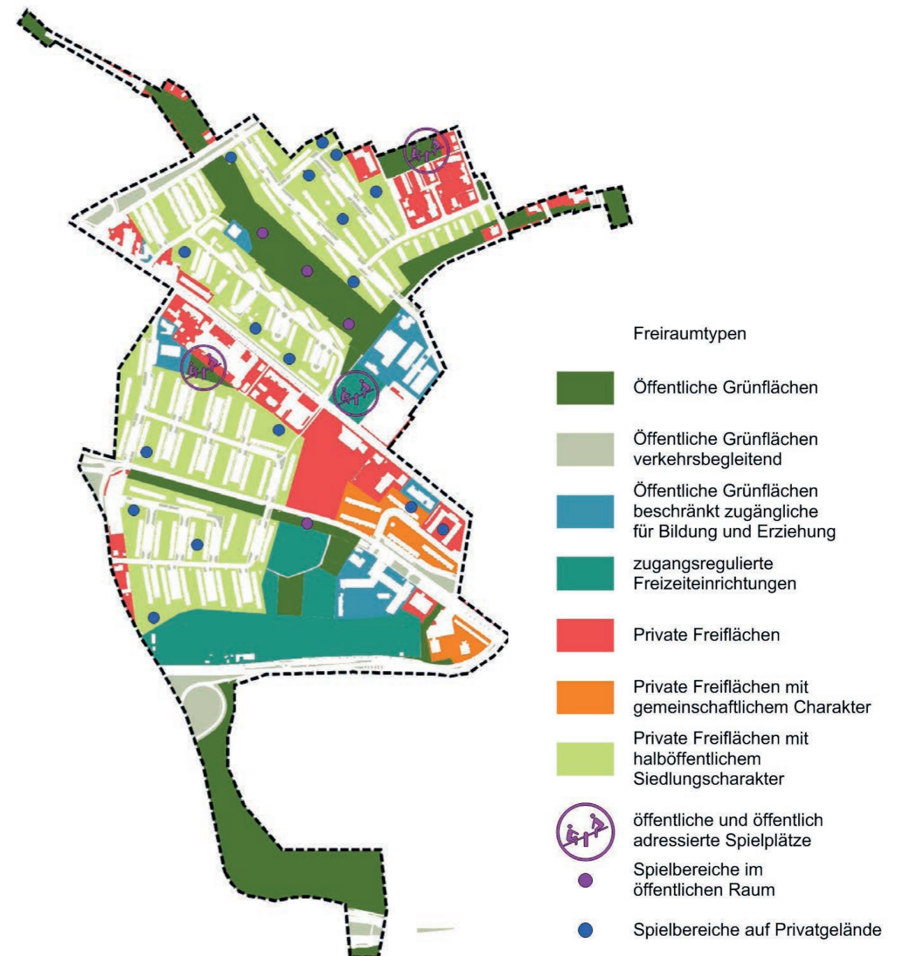
Abbildung 12: Analysekarte Freiraumtypen

Der alltägliche Austausch aus dem Gebiet in die angrenzenden Stadtteile wurde in verschiedenen Schlüsselpersonengesprächen insgesamt als gering eingeschätzt.