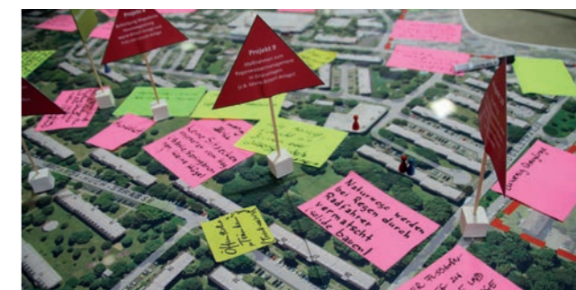
Abbildung 5: Hinweise der Einwohnerschaft während der Auftaktveranstaltung

Die Vorbereitenden Untersuchungen wurden auf Grundlage eines breiten Methodenkonzepts durchgeführt. Zu den Methoden gehören eine umfassende Datenauswertung, Begehungen, Befragungen und Interviews mit ausgewählten Schlüsselpersonen sowie eine umfangreiche Bürgerbeteiligung. Dies setzt die Etablierung von Handlungsfeldern und die Einbeziehung einer Vielfalt