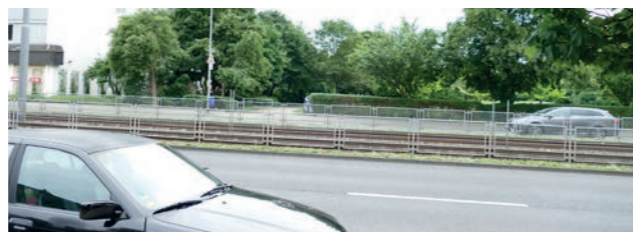
Abbildung 18: Situation an der Eschersheimer Landstraße

Die Klimsch-Anlage im ostlichen Ast des „Grünen Ypsilon“ ist eine kleine, wenig genutzte Grunanlage. Sie endet im Osten an der Eschersheimer Landstraße, die eine Barriere zum gegenuber anschließenden Sinai-Park bildet. Ziel ist eine Querung der Straße und der Gleise, um die Klimsch-Anlage und den Sinai-Park miteinander zu verbinden.