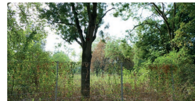
Abbildung 21: Brachflache am iranischen Konsulat

Derzeit ist der „Iranische Garten“, eine nicht zugangliche Flache zwischen Platenstraße und Raimundstraße, weitgehend in Privatbesitz und nicht offentlich zuganglich. Ziel ist es, durch einen Flachentausch eine Wegeverbindung im Westen der Flache zu gewinnen. Das Grunflachenamt der Stadt Frankfurt bemuhrt sich seit 15 Jahren um einen solchen Tausch und wird dies auch weiter tun.