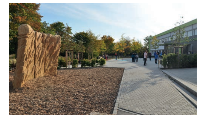
Abbildung 34: Beispiel für eine Schulhofnutzung öffentlicher Grünanlagen

Der Schulhof der Astrid-Lindgren-Schule ist während der Baumaßnahmen zur Erweiterung der Schule nur eingeschränkt nutzbar. Die ehemalige BMX-Fläche wird nicht mehr als solche genutzt. Ziel ist es, eine Spiel- und Freizeittfläche zu schaffen, die auch von der Schule mitgenutzt werden kann.