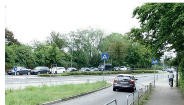
Abbildung 19: Situation an der Wilhelm-Epstein-Strae

Um die Miquelanlage mit dem Sportplatzband zu verbinden, ist eine Querung der Wilhelm-Epstein-Strae an geeigneter Stelle notig. Die Position hangt von mehreren Faktoren ab: Die Wilhelm-Epstein-Strae wird als mogliche Trassenfuhrung fur die geplante Ringstraenbahn in Frankfurt betrachtet und auf dem Gelande der Bundesbank sind umfassende Umbau- und Sanierungsarbeiten in den nachsten Jahren geplant. Auerdem ist das Projekt auf die Durchwegung des Sportplatzbandes (Projekt 1.10) abzustimmen.