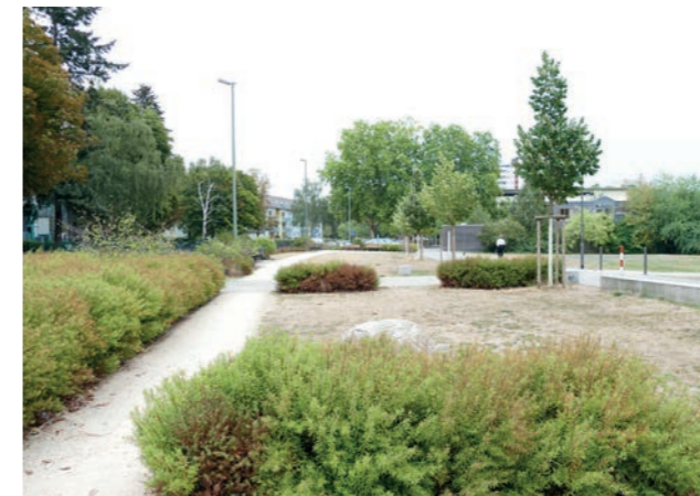
Abbildung 7: Spiel-, Lern- und Kulturmeile Platenstr.

Zentraler Attraktionspunkt der Anlage ist der vorhandene Weiher mit einem kleinen Bachlauf und Sprudelsteinen. Als einzige Wasserfläche im Fördergebiet ermöglicht er ein besonderes Naturerlebnis und ist, wie in der Beteiligung vielfach berichtet wurde, ein beliebtes Ausflugsziel. Als technisches Bauwerk unterliegt der Weiher einem gewissen Unterhaltungs- und Pflegeaufwand. Insbesondere in den Sommermonaten ist die Wasserqualität des Weihers stark gefährdet und droht bei anhaltenden Hitzeperioden umzukippen. Hier ist ein ökologischer Umbau des Weihers zur Sicherung der Wasserqualität notwendig.