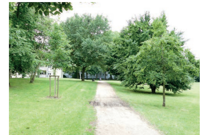
Abbildung 9: Unbefestigte Wege in der Marie-Bittorf-Anlage

Als nicht-öffentliche Grünfläche sind zwischen Platenstraße und Raimundstraße die Freianlagen des Generalkonsulats der Islamischen Republik Iran vorhanden. Die Fläche ist allseitig umfriedet und nicht zugänglich oder einsehbar. Anhand der Luftbilddaten ist zu erkennen, dass die Freianlagen vor allem grün geprägt sind. In Randbereichen sind größere Gehölze vorhanden. Ein Teil der Fläche soll geöffnet werden, um eine Wegeverbindung zwischen Raimundstraße und Platenstraße zu schaffen.