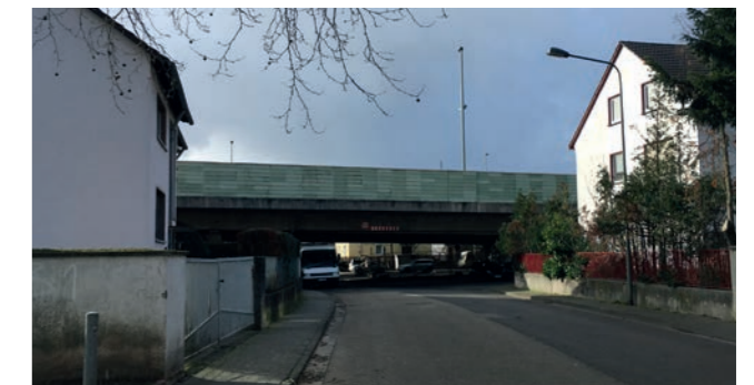
Abbildung 28: Anbindung Franz-Werfel-Straße