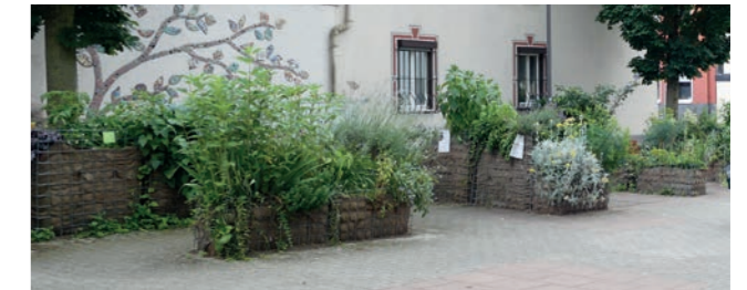
Abbildung 39: Beispiel urbaner Garten – Ginnheimer Kirchplatzgärtchen

Im Fördergebiet gibt es nur wenige private Gärten, die Menschen im Gebiet wünschen sich mehr Gartenflächen. Kleinteilige Gemeinschaftsgärten, nach dem Vorbild des Gallus Gartens in Frankfurt und dem urbanen Garten am Ginnheimer Kirchplatz, können auch im „Grünen Ypsilon“ entstehen. Wichtig dafür ist die Kooperation mit lokalen Akteuren.