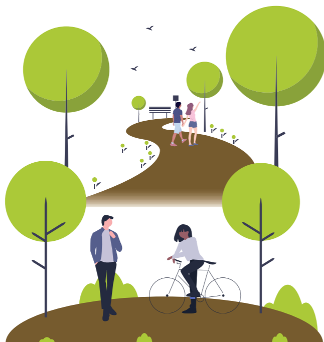
Abbildung 3: Wege – Treffpunkte – Biodiversität

Eine zukunftsfähige Gestaltung, die ökologische und soziale Ansprüche verbindet, ist als drittes Ziel zu nennen. Eine erhöhte Biodiversität, etwa durch Gärten, Obstbäume und vielfältige Lebensräume, bietet Anknüpfungspunkte für Umweltbildung und gemeinschaftliche Aktivitäten.