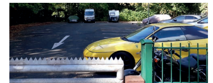
Abbildung 29: Lage der Anbindungsmöglichkeit zwischen Miquelanlage und C.-v.-W.-Siedlung

Die Carl-von-Weinberg-Siedlung ist eine der letzten amerikanischen Wohnsiedlungen in Frankfurt. Durch eine Wegeverbindung über den angrenzenden Parkplatz kann ein attraktiver und direkter Zugang der Siedlung zu den Freianlagen des „Grünen Ypsilon“ geschaffen werden.