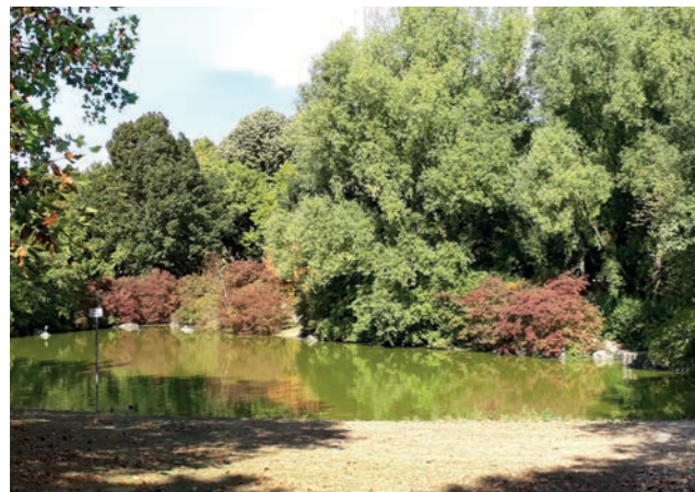
Abbildung 6: Miquelweiher

Im Süden des Fördergebietes ist die aus den 1970er-Jahren stammende Miquelanlage . Sie verfügt über einen üppigen Baumbestand, der zusammen mit den Geländemodellierungen von den anliegenden Schnellstraßen abschirmt. Die Anlage erstreckt sich bogenförmig entlang des Kreuzes zwischen der Miquelallee und der Rosa-Luxemburg-Straße und stellt im Konzept des „Grünen Ypsilons“ das Bein des Ypsilons dar. Durch eine Brücke ist sie direkt an den Grüneburgpark angebunden. In der gesamtstädtischen Grünvernetzung ist damit im weiteren Verlauf nach Süden auch eine Anbindung an den Unicampus der Goethe-Universität, den Palmengarten sowie den Alleenring mit Senckenberg- und Friedrich-Ebert-Anlage gegeben. Die Brücke ist zwar technisch in einem guten Zustand, deren Zugänge sind aber nicht barrierefrei. Auch nach Westen ist die Miquelanlage über eine Brücke an