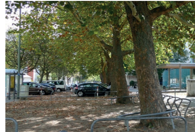
Abbildung 26: Stellplatzbereich östliche Platenstraße

Zwischen der Astrid-Lindgren-Schule in der Platenstraße und der Wilhelm-Epstein-Straße soll eine Fuß- und Radwegeverbindung entstehen. Entlang der Platenstraße, zwischen der Astrid-Lindgren-Schule und der Ernst-Schwendler-Straße soll eine gut nutzbare Fuß-/Radwegeverbindung entstehen. Zur Verbesserung des Anschlusses an die bestehende Verbindung sind folgende Themen vertiefend zu untersuchen: die Ordnung der Stellplatzbereiche, die Aufwertung der Wegeflächen und die Entflechtung von Fuß- und Radverkehr.