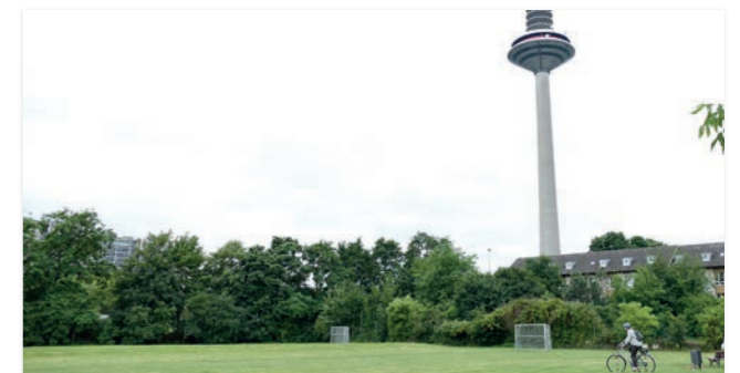
Abbildung 22: Lage der Wegeverbindung

In diesem Abschnitt existiert bisher keine Wegeverbindung. Der neue Weg fuhrt durch den Grunzug Platenstraße von der Platenstraße aus nach Suden zu den Sportplatzen. So entsteht auch ein leichter Zugang zu den Sportanlagen. Die Wegeachse kann nach Suden in direkter Verbindung durch das Sportplatzband und nach Norden als Fortsetzung im Iranischen Garten gefuhrt werden und ermoglicht so eine sehr direkte und attraktive Wegeverbindung.