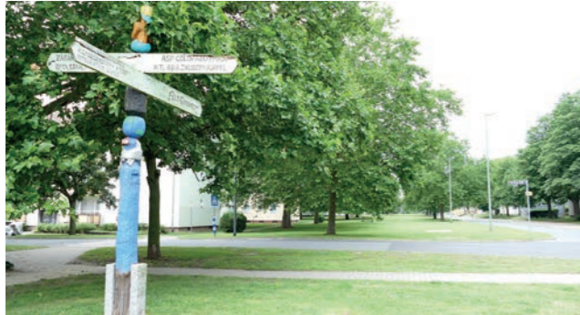
Abbildung 10: Wenig genutztes Abstandsgrün

Durch die Siedlungsstruktur ist im gesamten Gebiet ein hoher Anteil an halböffentlichen Freiräumen vorhanden. Diese Freiflächen sind eigentumsrechtlich private