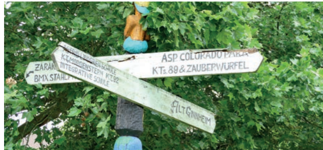
Abbildung 30: Wegweiser an der Platenstraße

Ziel ist es, ein Leitsystem zu erstellen, das auf die bestehenden, aber insbesondere auch auf die zukünftigen Wegeverbindungen im „Grünen Ypsilon“ und die verschiedenen Attraktionen hinweist.