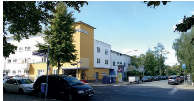
Abbildung 17: Querungssituation an der Kurhessenstraße

In der Kurhessenstraße fehlt eine gute Quersungsmöglichkeit für Fahrradfahrer/innen und Fußgänger/innen in direkter Anbindung an die Fritz-von-Unruh-Anlage. Eine Fahrbahnverengung und ein Zebrastreifen oder die Versetzung der bestehenden Fußgängerampel sollen mehr Sicherheit schaffen und die Durchlässigkeit innerhalb des „Grünen Ypsilon“ verbessern. Die Lösung ist aus einer verkehrsplanerischen Gesamtbetrachtung des Kreuzungsbereichs zu entwickeln.