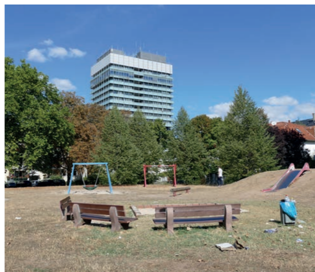
Abbildung 11: Gleichförmige Spielplätze

Eingestreut in die Siedlungsbausteine finden sich Spielplätze bzw. kleinere Spielbereiche mit verschiedenen Spielgeräten. Meist wirken die angebotenen Schaukeln, Sandkästen, Wippen oder Wipptiere jedoch nur frei in der Fläche abgestellt und bieten nur wenig Anreiz und einen eher geringen Spielwert. Ein weiterer städtischer Spielplatz grenzt hinter dem Gelände der Kindertagesstätte in der Stefan-Zweig-Straße an. Dies ist der einzige, zentral im Gebiet gelegene Spielplatz. Der Spielplatz an der Adalbert-Stifter-Straße ist einer von insgesamt nur drei öffentlichen Spielplätzen direkt im Fördergebiet. Am Ende der Straße Höhenblick ist der dritte öffentliche Spielplatz im direkten Umfeld des Fördergebietes vorhanden. Diese Spielplätze sind eher den angrenzenden Wohngebieten zuzuordnen. Entlang des Wegenetzes des Grünen Ypsilons fehlen öffentliche Spielplätze.