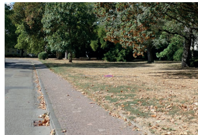
Abbildung 25: Anlage entlang der Jean-Paul-Straße

Schon jetzt ist der Wegebelaag in der Klimsch-Anlage in einem grenzwertigen Zustand. Ziel ist es, verkehrssichere Wegeflächen in der Klimsch-Anlage anbieten zu können, die witterungsunabhängig genutzt werden können und langlebig sind. Außerdem wird eine Entflechtung von Fuß- und Radverkehr angestrebt. Eine Freigabe der Wege für den Radverkehr soll nur im äußersten östlichen Teil erfolgen. Im westlichen Teil der Klimsch-Anlage wird angestrebt, den Radverkehr aus der engen Anlage gesichert auf die wenig befahrene Straße zu lenken.