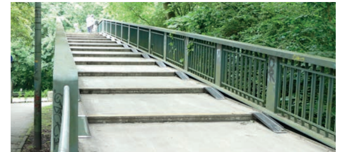
Abbildung 20: Brucke uber die Miquelallee

Die viel genutzte Fußgangerbrucke uber die stark befahrene Miquelallee ist die einzige Verbindung vom „Grünen Ypsilon“ zum sudlich gelegenen Grunenburgpark. Fur eine bessere Querung – vor allem fur Personen mit Fahrrad, Kinderwagen, Rollator oder Rollstuhl – sollen die Schlepptufen durch eine durchgangige Rampe ersetzt werden.