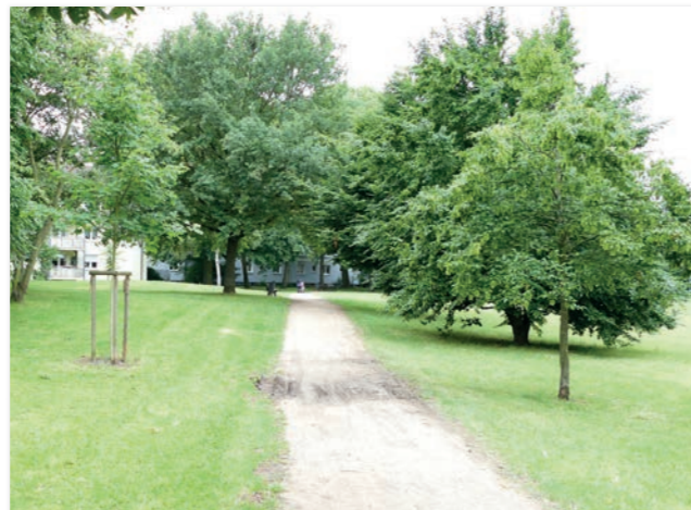
Abbildung 24: Unbefestigte Wege in der Marie-Bittorf-Anlage

Derzeit weisen die Wege in der Marie-Bittorf-Anlage und der Fritz-von-Unruh-Anlage deutliche Beeinträchtigungen durch den Radverkehr auf. Ziel ist es, verkehrssichere Wegeflächen in der Marie-Bittorf sowie der Fritz-von-Unruh-Anlage anbieten zu können, die witterungsunabhängig genutzt werden können und langlebig sind. Der aktuelle Bodenbelag ist beschädigt und durch den regen Radverkehr nicht langfristig instandzuhalten. Eine befestigte Bauweise z. B. mittels Farbasphalt ist als Belag grundsätzlich geeignet und kann auch die gestalterischen Bezüge innerhalb des gesamten „Grünen Ypsilon“ erzielen. Die Entwässerung der Oberfläche soll seitlich in die angrenzenden Grünflächen erfolgen. Zur Minimierung von Konflikten zwischen Radfahrer/innen und Fußgänger/innen wird eine Qualifizierung zur Stärkung des Radverkehrs angestrebt.