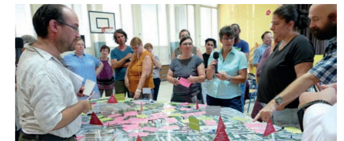
Abbildung 13: Auftaktveranstaltung

Im Rahmen der öffentlichen Auftaktveranstaltung am 9. August 2018 gab es für alle Interessierten die Möglichkeit, sich umfassend zu informieren und Hinweise und Kommentare direkt an das Planungsteam zu geben.