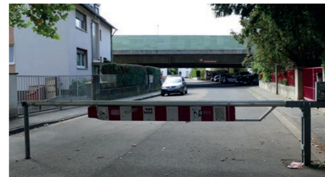
Abbildungen 27: Schranke an der Franz-Werfel-Straße

Erschließung demontiert. Eine Verschönerung des Umfelds steht noch aus.