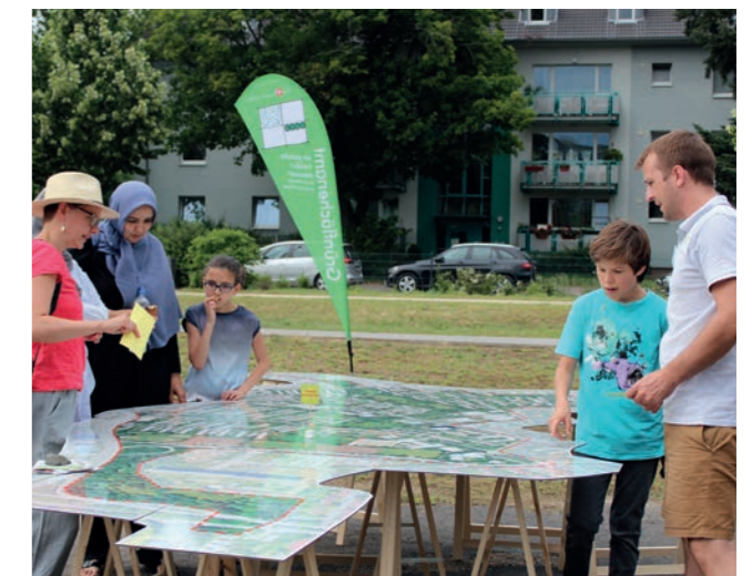
Abbildungen 33: Mitmach-Aktion Grünzug Platenstraße am 22. Juni 2020